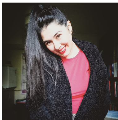
Doctorado en Ciencias con mención en Química (Postgrado finalizado)

Investigar para una sociedad sustentable y digna. Investigar para una nueva forma de desarrollo. ¡Investigar es trabajar!